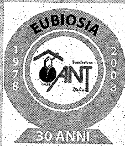
Il logo dell'Associazione nazionale tumori

"Le richieste sono in costante aumento, pertanto è necessaria la collaborazione di tutti" dichiarano i responsabili cittadini dell'associazione. Per informazioni e inviti è possibile rivolgersi presso la Delegazione Ant di Molfetta – corso Margherita di Savoia 18 (tel. 080.335.47.77) dal lunedì al venerdì dalle ore 9.00 alle 12.00 oppure dalle 17.00 alle 19.00.