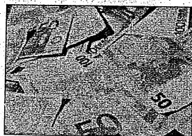
La scarsa liquidità preoccupa